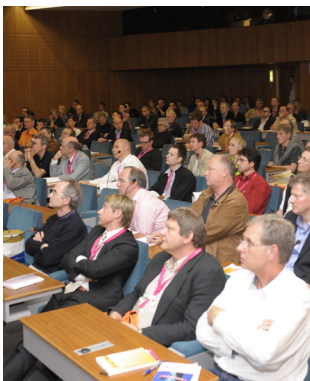
In Vortragsblöcken wird zum Thema Osteologie informiert