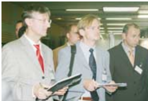
Begehung der Posterausstellung durch die Bewertungskommission 2004